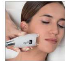
NATURAL & EFICAZ

RESULTADOS VISIBLES, ¡DESDE LA 1ª SESIÓN!